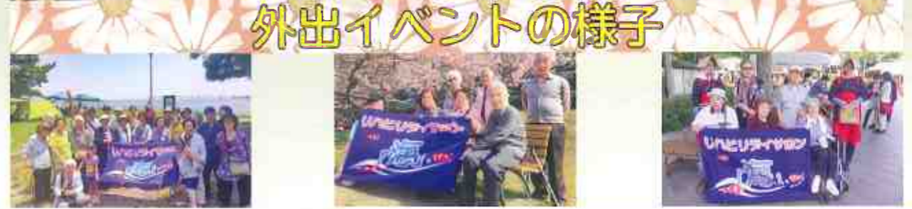
外出イベントの様子

平成26年には2号店となるリハビリデイサロン「海」MIHARUを横須賀市三春町に開設し、3フロアー1日定員138名の大規模事業所として大勢の利用者様にご利用いただいております。