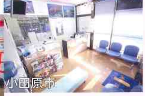
珊瑚薬局グループ Sango Pharmacy Group